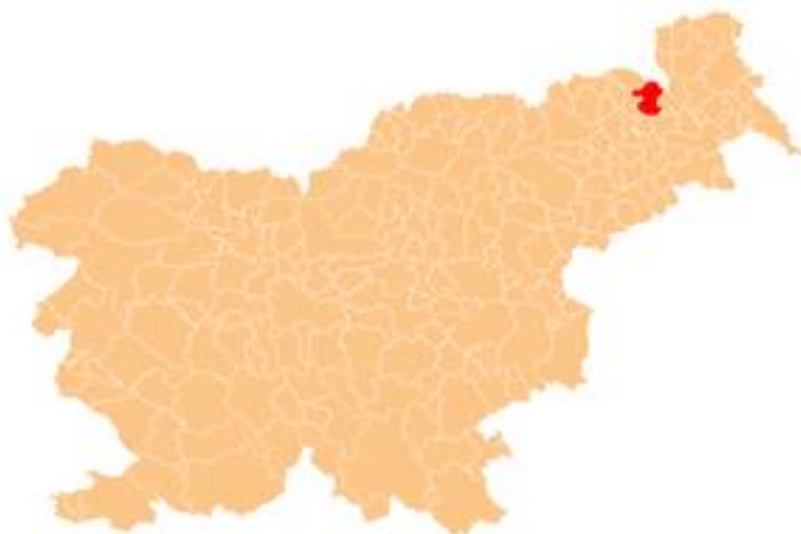
Slika 2: Lega Občine Gornja Radgona v Republiki Sloveniji